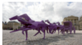
Sculptures de Xavier Veilhan dont celle créée pour Versailles

Pour les plus jeunes, faire raconter l'histoire.